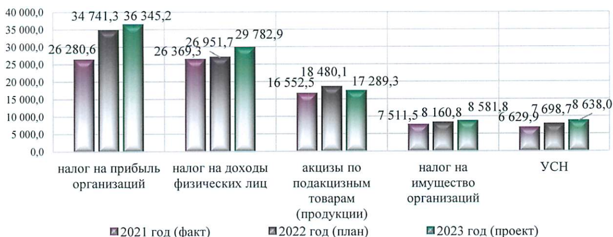
Основные налоговые доходы областного бюджета, млн. руб.

Увеличение доходной части областного бюджета в 2023 году обусловлено ростом налоговых доходов на 4622,2 млн. руб., или на 4,7 процента. Поступления неналоговых